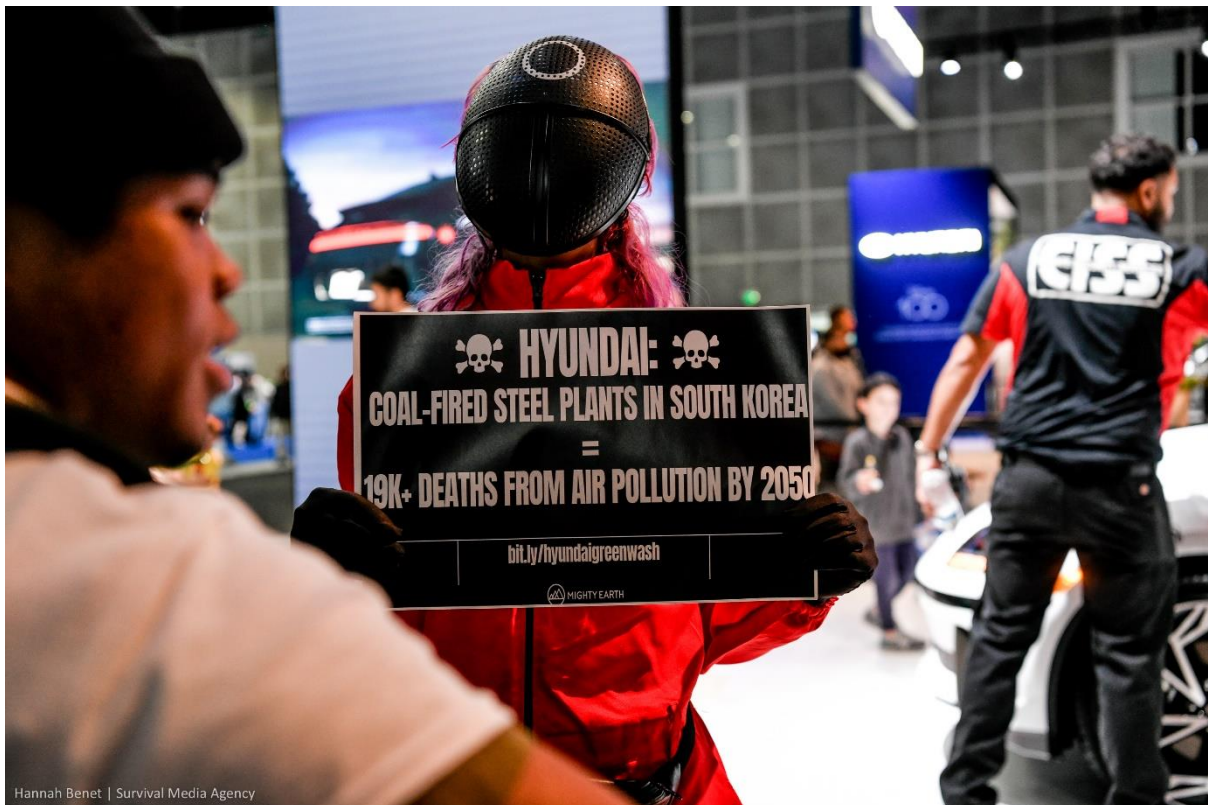
[그림1] 18일(미국 현지시각) LA 오토쇼에서 현대 자동차의 그린워싱에 항의하는 활동가 사진. 마이티

18일(현지 시각) 미국 로스앤젤레스 오토쇼에서 현대자동차가 자동차 생산 공급망에서 더러운 석탄을 사용하는 것에 항의하는 기후·청소년 단체 활동가들이 '오징어게임' 의상을 입고 시위를 벌였다. 이들은 세계에서 세 번째로 큰 자동차 제조업체인 한국의 현대차가 전기자동차 중심 체제로 전환하는 과정에서 기후위기 대응에 걸맞게 무탄소 철강 등의 부품을 사용하고 일부 공급망에서 벌어지는 아동 노동을 중단하도록 촉구하였다.