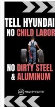
이날 미국 유력 일간 LA타임스 전면 캠페인 광고 사진