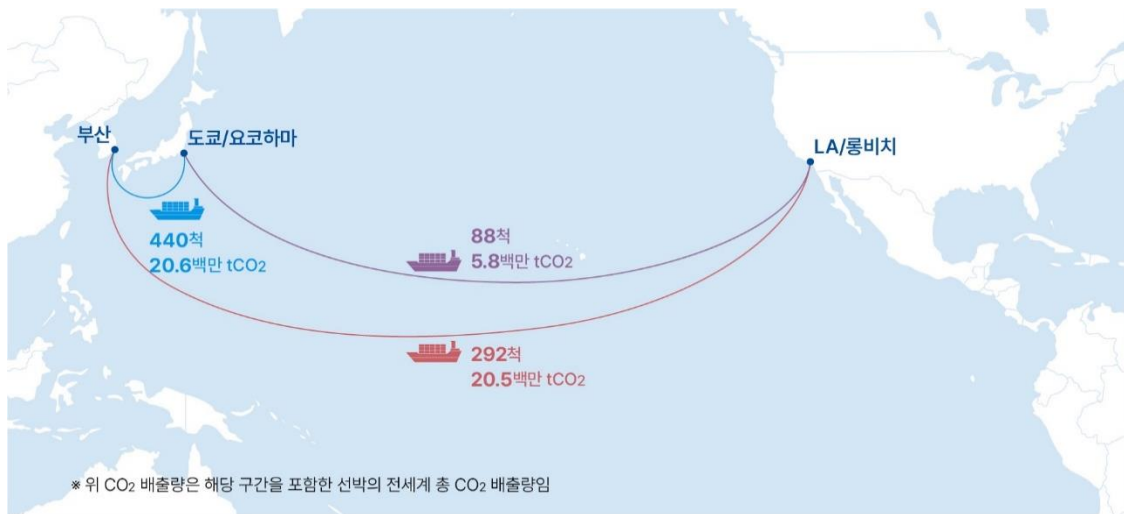
<그림 4> 부산—도쿄/요코하마—LA/롱비치 항로 이산화탄소 배출 현황

염정훈 책임은 “진정한 녹색해운항로 구축을 위해서는 대한민국 항만, 해운사, 정부 등 여러 이해관계자들이 다양한 역할과 책임을 다해야 한다. 항만의 경우, 항만기본계획 수정을 통해 항만들의 녹색 전환을 앞당기고, 해운사들은 항로에 저탄소 또는 무탄소 선박들을 앞당겨 확대 투입할 수 있을 것이다. 나아가 녹색해운항로의 활성화를 위해 정부에서 관련 법과 계획을 정비를 한다면 긍정적 변화를 기대해 볼 수 있을 것”이라며 “또한 녹색해운항로의 목적은 단순히 온실가스 배출량 감축에만 있지 않으며 여러 유관 산업의 지속가능성을 향상시키는 데 있다는 것을 염두에 두어야 한다”고 밝혔다. /끝/